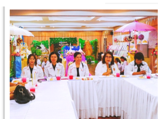
ผู้บริหาร และครู เป็นวิทยากรเผยแพร่การพัฒนาคุณธรรม