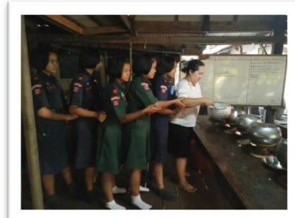
คณะครูและนักเรียนทำบุญตักบาตร ฟังธรรมทุกวันพระ ที่วัดพุน้ำร้อน