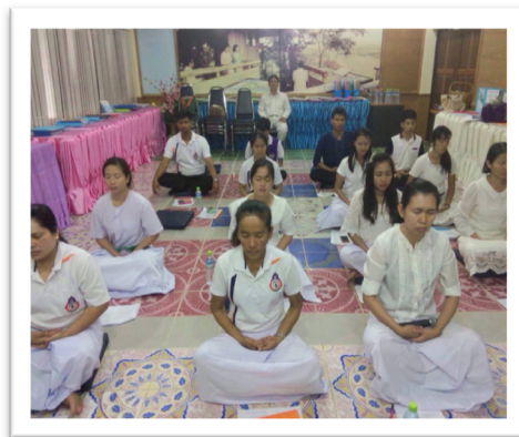
นักเรียน ครู บริหารสมอง นั่งสมาธิ ก่อนทำกิจกรรมต่างๆ