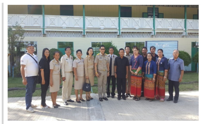
รับการนิเทศจากองคมนตรี พลเอกไพบูลย์ คุ้มฉายา