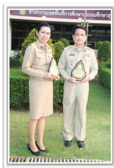
ได้รับรางวัล MOE AWARDS ผลงานระดับดีเด่น ประเภทสถานศึกษา สาขา เทิดทูนสถาบันชาติ ศาสนา และพระมหากษัตริย์ ปีการศึกษา ๒๕๕๘