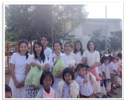
ทำบุญตักบาตรวันขึ้นปีใหม่