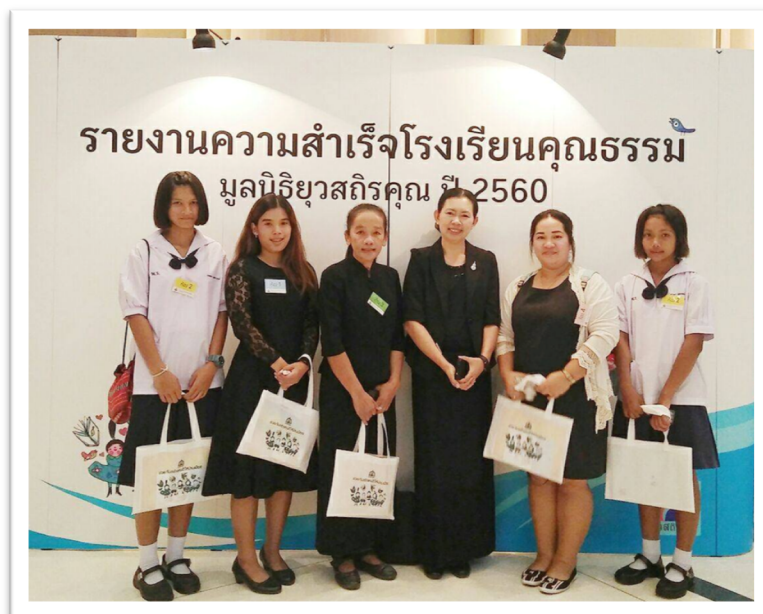
เผยแพร่โรงเรียนคุณธรรม