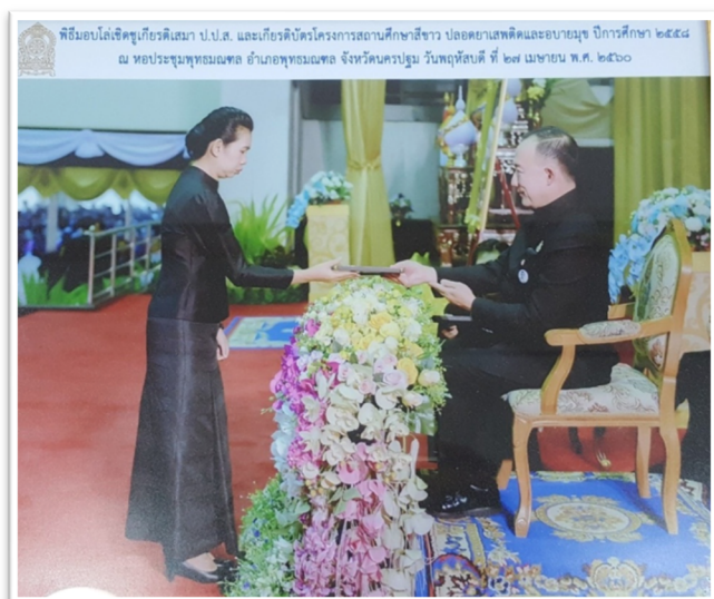
ได้รับรางวัลเสมา ป.ป.ส. ผลงานดีเด่นระดับเงิน โครงการสถานศึกษาสีขาว ปลอดภัย เสพติดและอบายมุข ปีการศึกษา ๒๕๕๘ วันที่ ๒๗ เมษายน พ.ศ. ๒๕๖๐