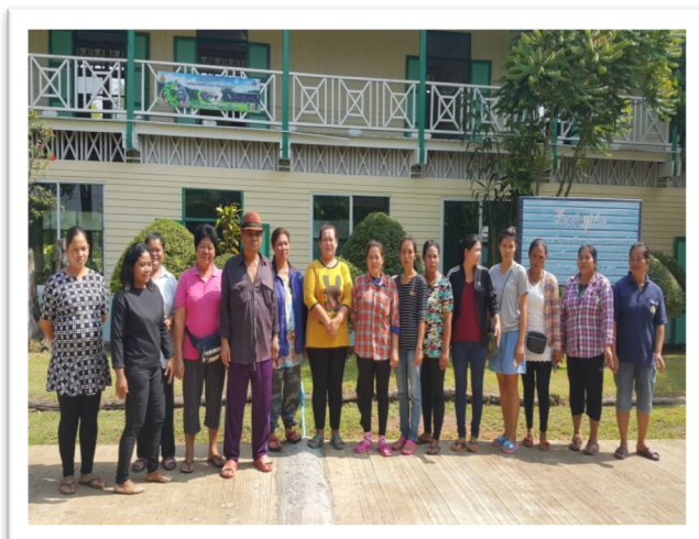
ประชุมผู้ปกครองอาสาพัฒนาคุณธรรม