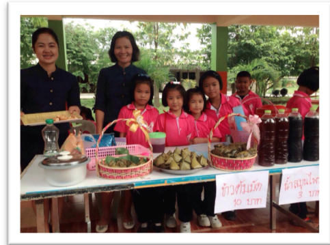
กิจกรรมตลาดนัดพอเพียง