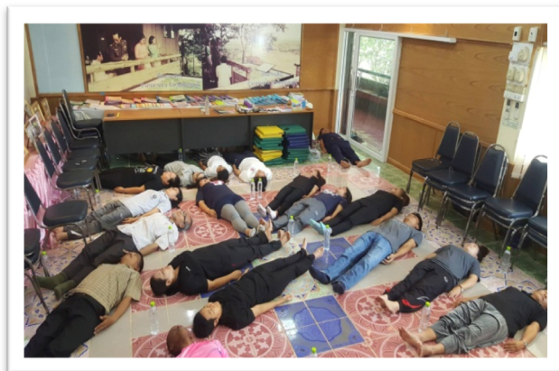
อบรมครูแกนนำ ทบทวนคุณธรรมอัตลักษณ์ทุกสิ้นปีการศึกษา และ กิจกรรม PLC ทุกวันพุธ (กิจกรรมโยคะ)