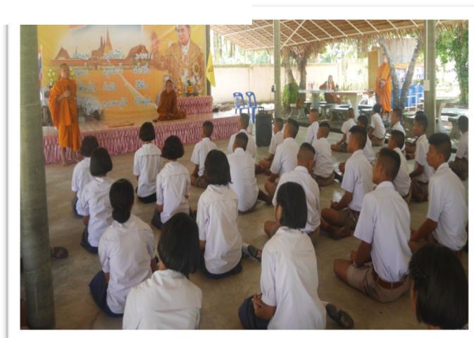
พระสอนธรรมศึกษากับนักเรียนทุกสัปดาห์