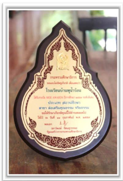
ได้รับรางวัล MOE AWARDS ผลงานระดับดีเด่น ประเภทสถานศึกษา สาขา ส่งเสริมคุณธรรม จริยธรรม ปีการศึกษา ๒๕๕๗