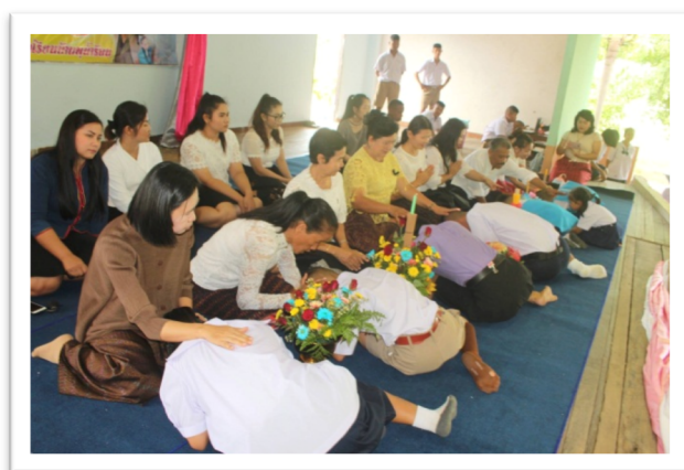
กิจกรรมวันไหว้ครู และกิจกรรมกราบครูของแผ่นดินในหลวง รัชกาลที่ ๙