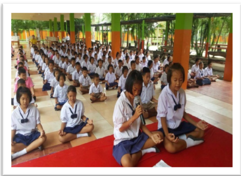
กิจกรรมวิถีพุทธทุกวันศุกร์