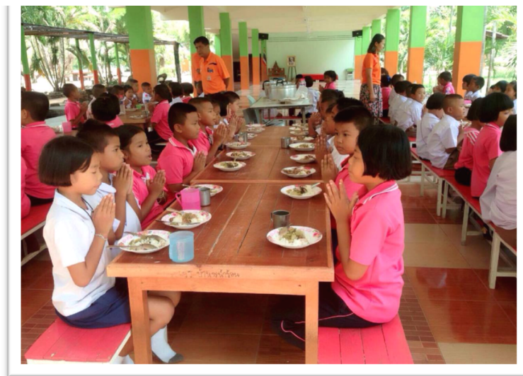
การฝึกกราบประทานอาหารอย่างเป็นระเบียบ