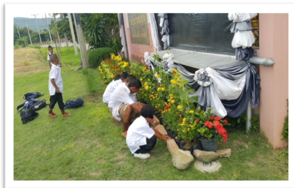
กิจกรรมจิตอาสาของคณะครู นักเรียน